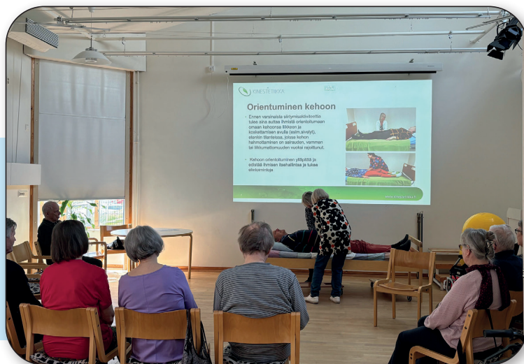
Yhteinen kinestetiikkakoulutus keväällä -24.

Syyskuussa on Leppävaaran Elä ja asu-keskuksessa alkamassa samankaltainen kahvila, johon omaishoitaja voi tulla ja tuoda kahvilan ajaksi hoidettavansa SPR:n vapaaehtoisten ohjaamaan ryhmään.